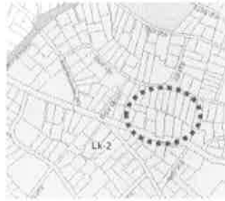
TSZT – Területfelhasználás