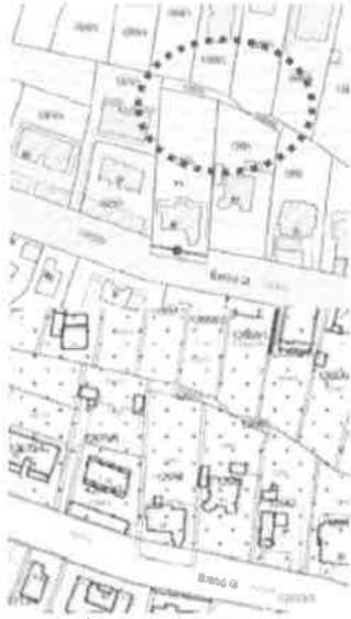
KÉSZ 1. melléklet